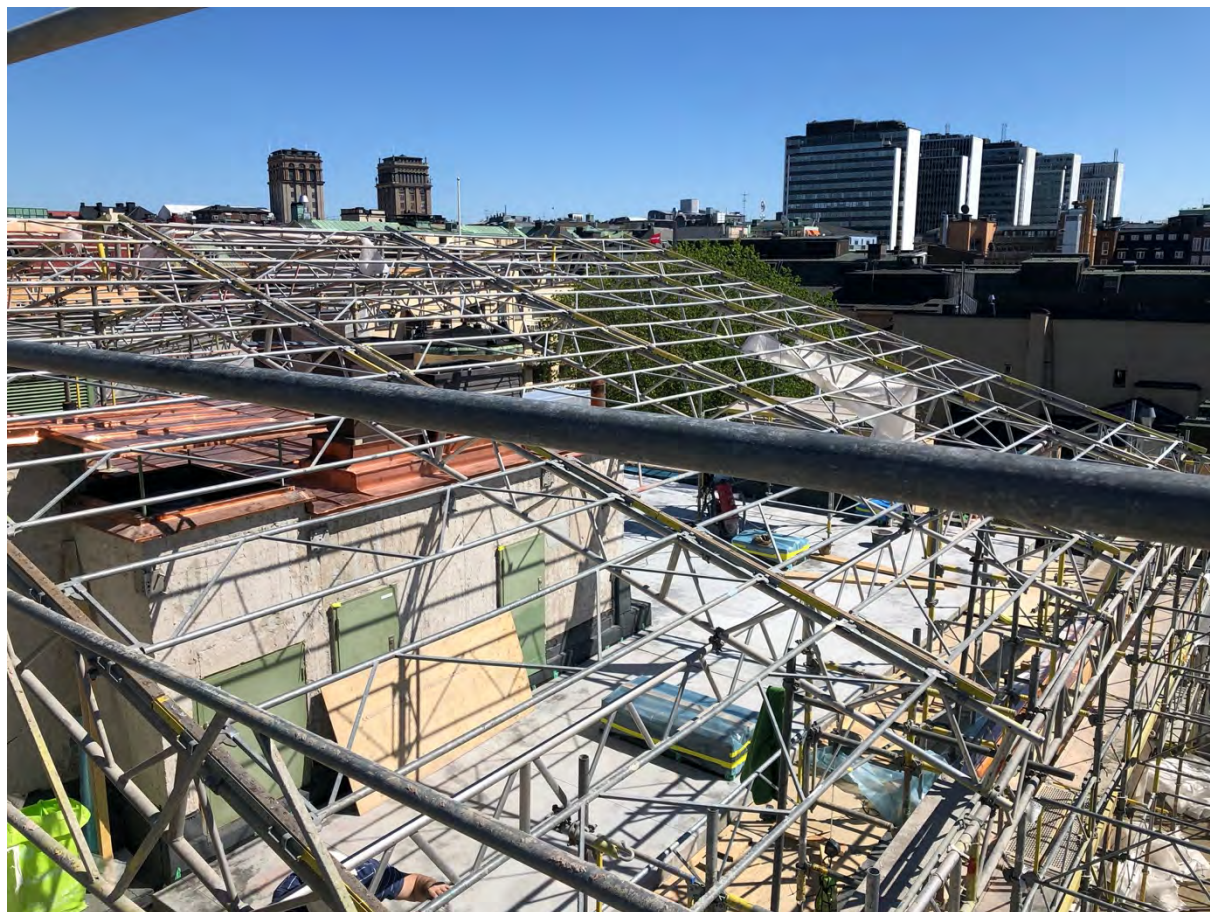
Taket över 90A rivet