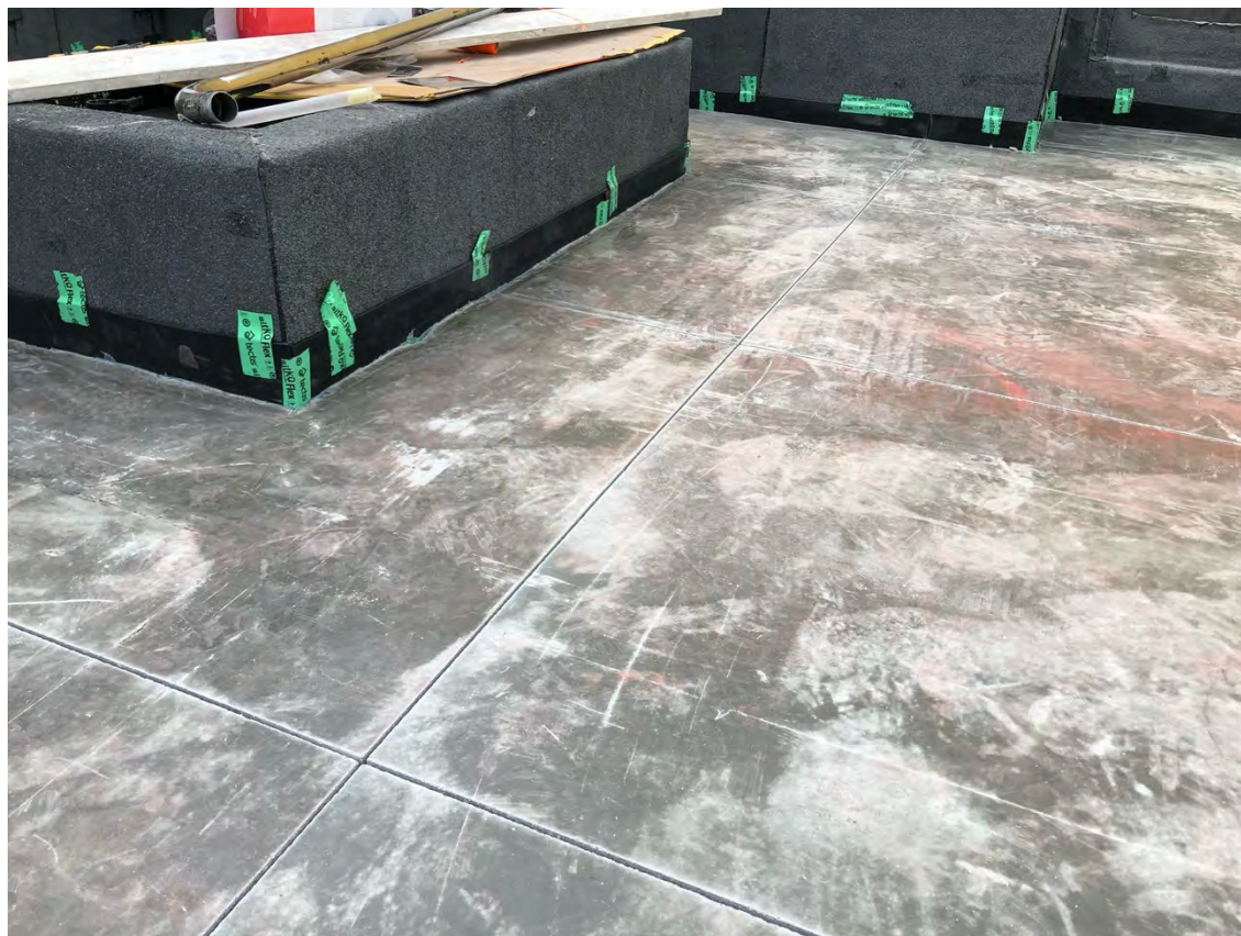
Den nya betongen skäras upp i rutmönster som sedan fylls med betong i annan kulär.