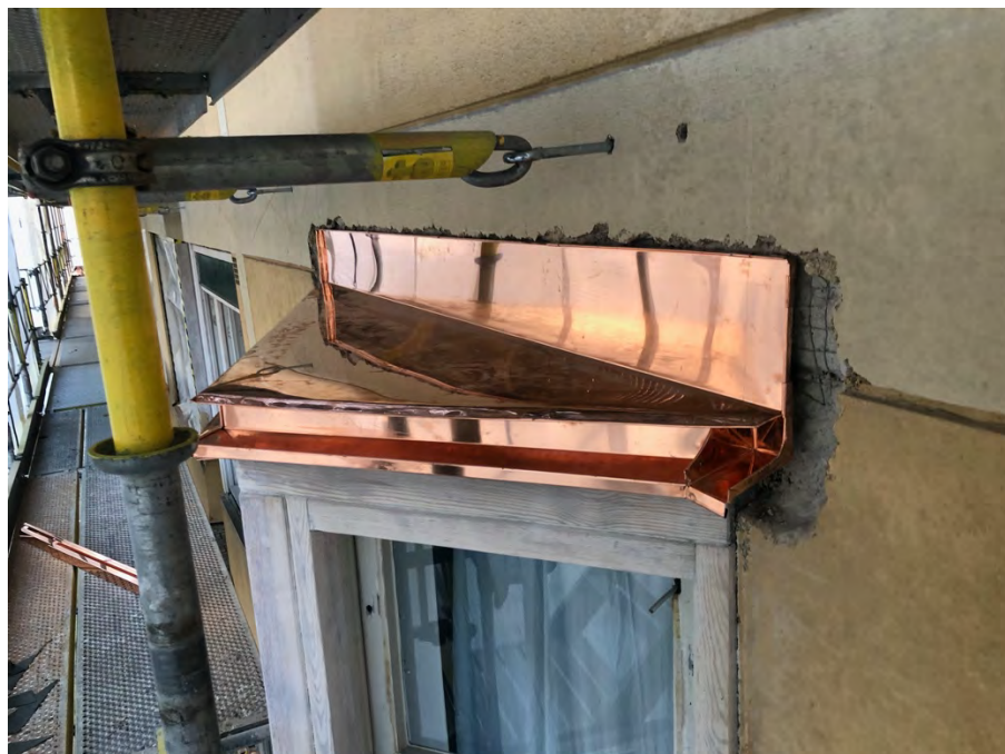
Ny koppar ovanför burspråken på de privata terrasserna.