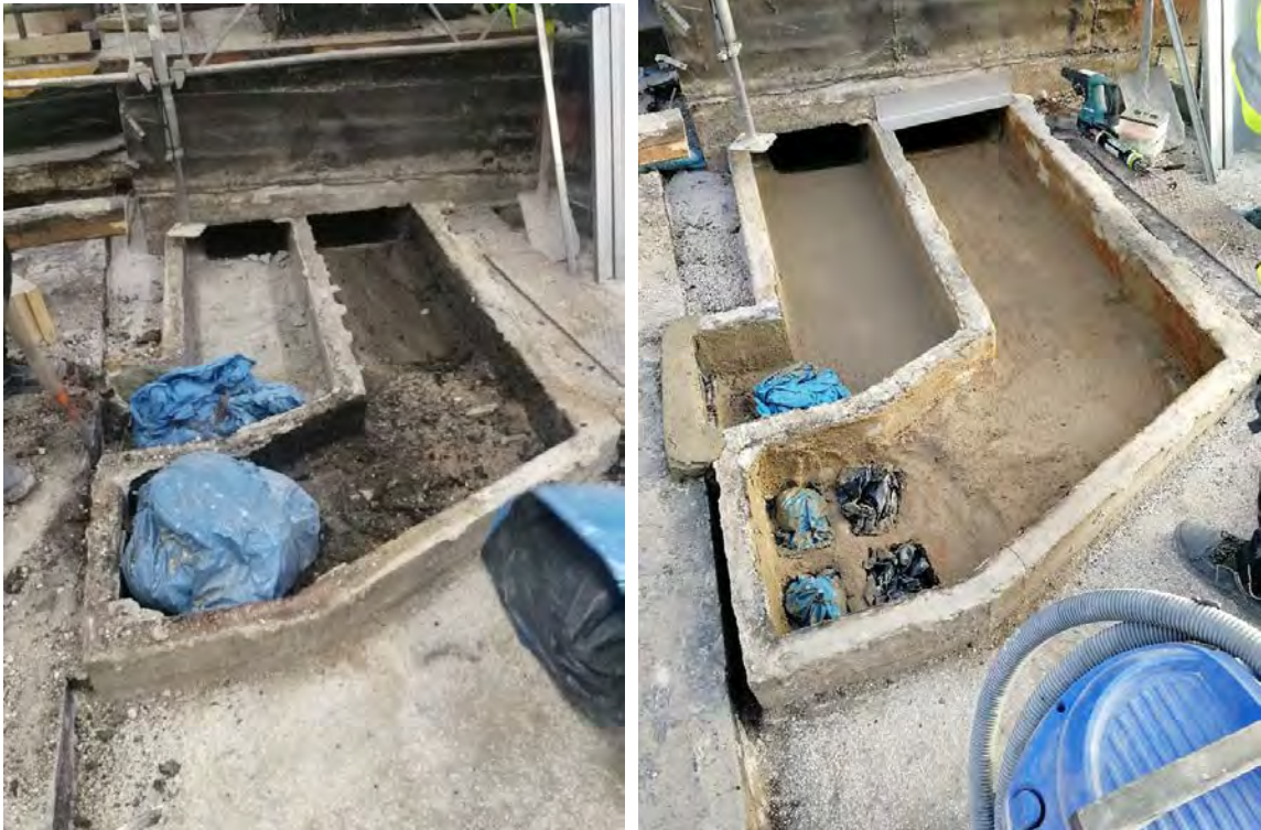
De horisontella rökgångarna och ventilationskanalerna under terrassens ytskikt. Bilden till vänster visar 80 års sotavlagringar som skyfflats(!) ihop innan kanalerna rengjorts och tätats (till höger).