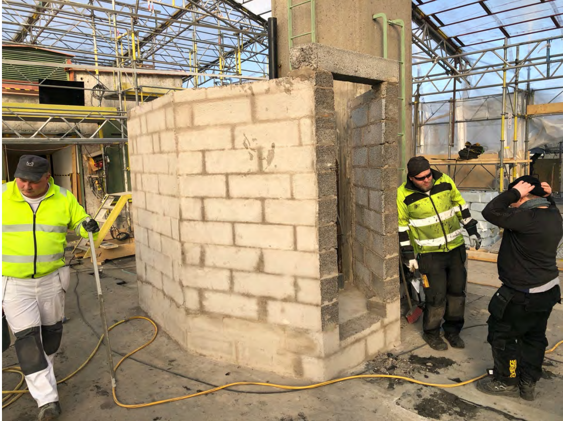
Det lilla skjulet mellan 90B och AF15 byggs upp igen.