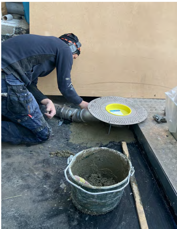
Ovan till vänster: Här monteras cellglasskivor (90A). De ger huset bättre energiprestanda och isolerar mot ljud från terrassen ner till lägenheterna under. Till höger: De nya dagvattenbrunnarna monteras och förberedes för tätskiktet. Ovanpå cellglaset kommer tätskiktet att läggas och sedan gjuts cirka 15 cm armerad slitbetong.