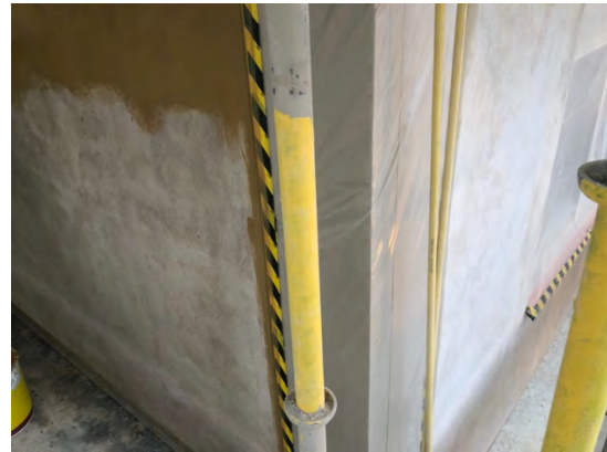
Puts av fasaderna