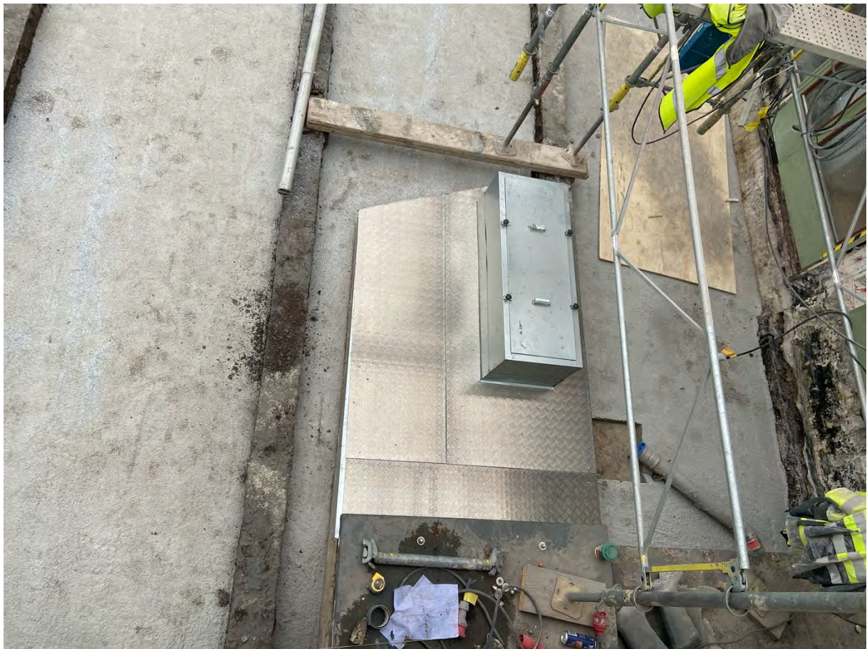
Ventilationskanalerna tätas med ny plåt innan de gjuts igen.