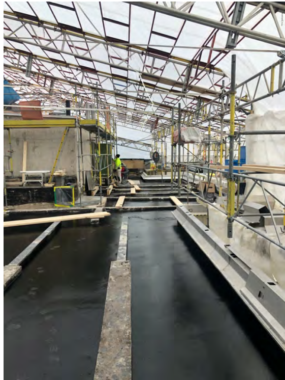
Efter cellbetongen läggs en tunn asfaltsprimer som gör att cellglaset kan klistras fast.