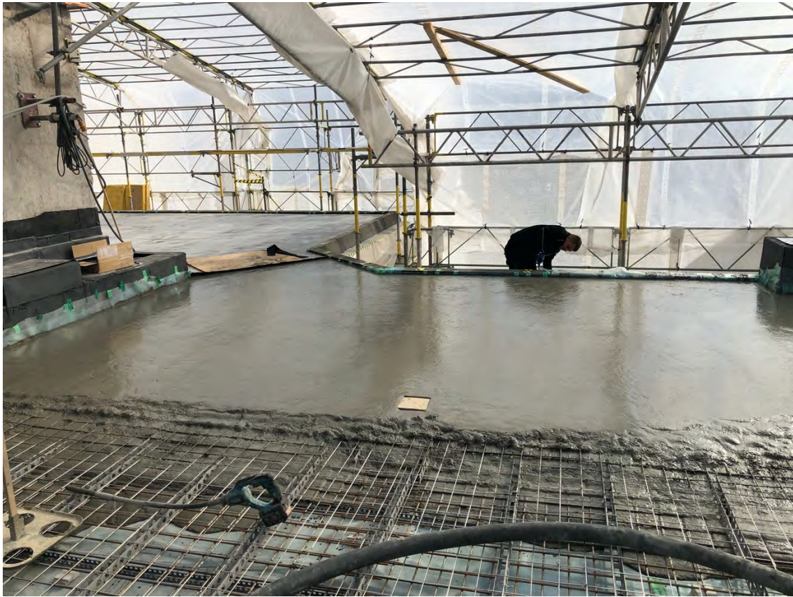
Betonggjutning på 90A