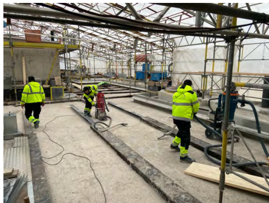
Till vänster: Terrassens nakna bjälklag efter att all fyllning är avlägsnad. Därefter har ett tunt lager cellbetong gjutits på.