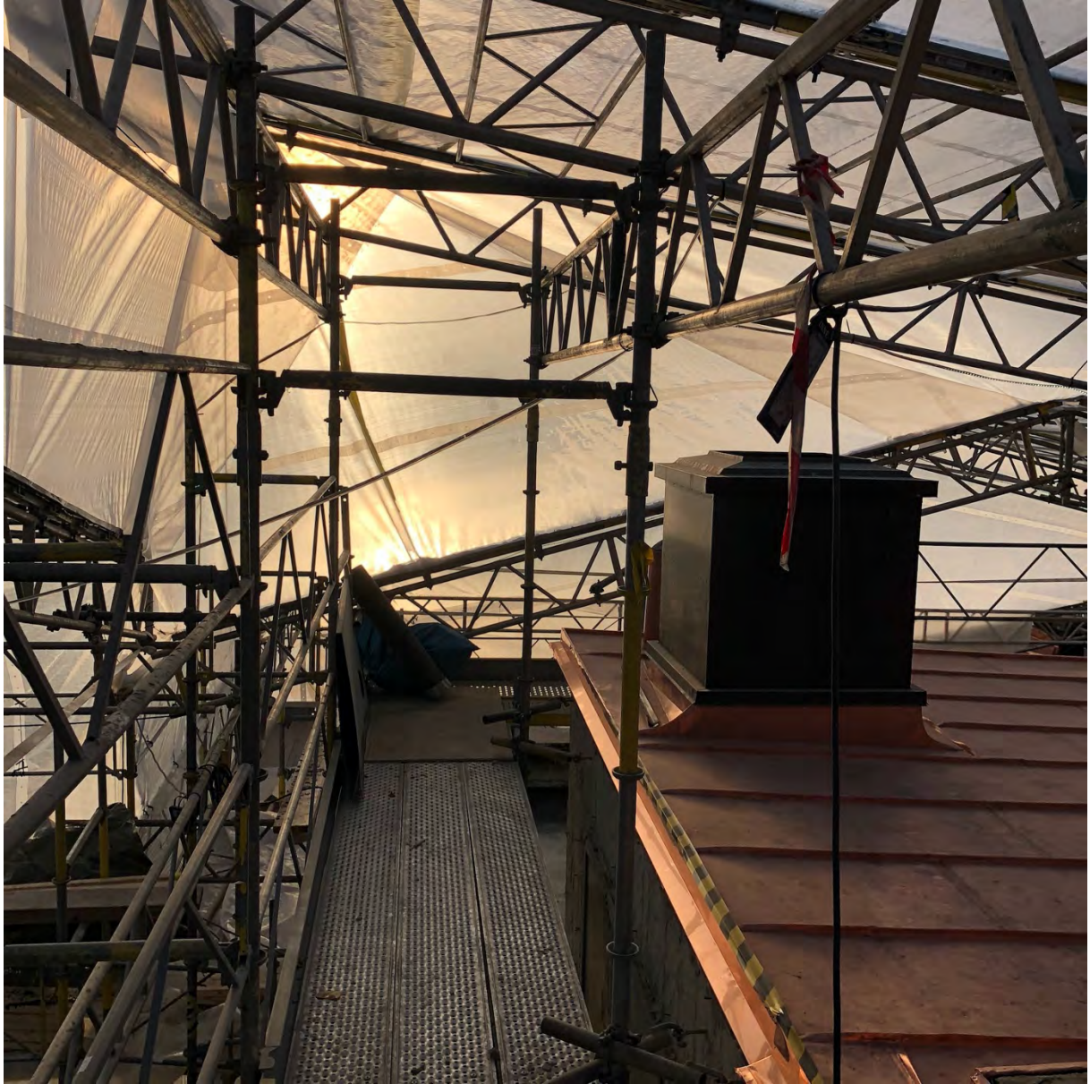
Det nya koppartaket på trapphusen