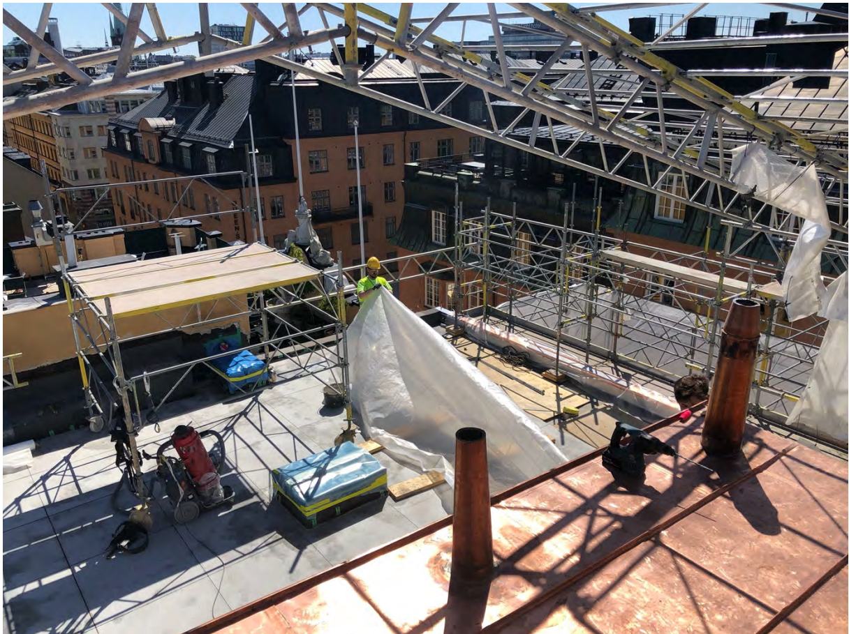
Taket över 90A rivs