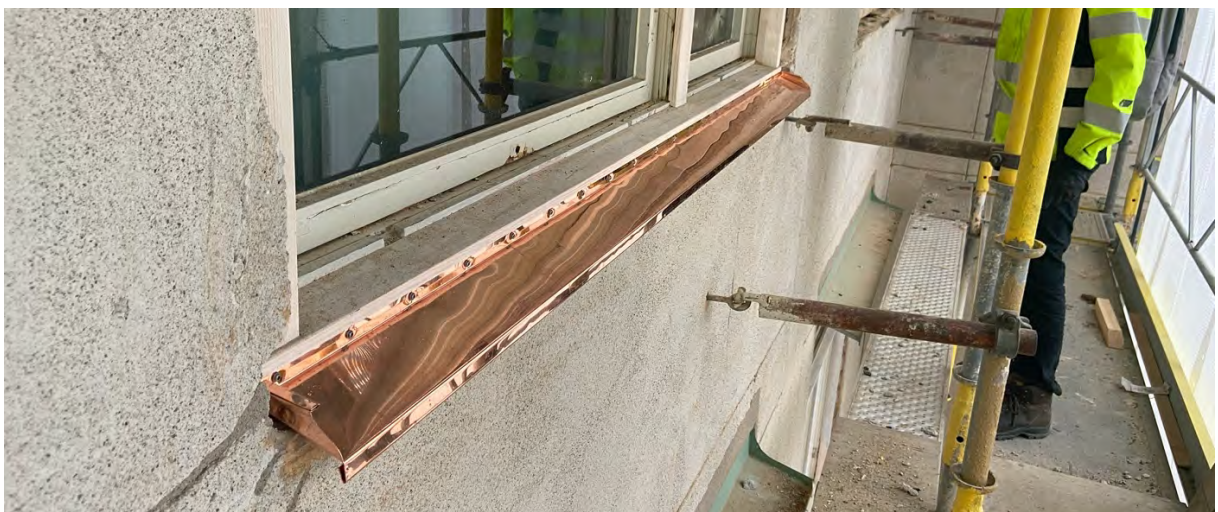
Nya fönsterbleck i koppar på gårdsfasaden (obs, fasaden ännu ej putsad)